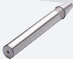
Kontrolldorne Test arbors Mandrins de contrôle